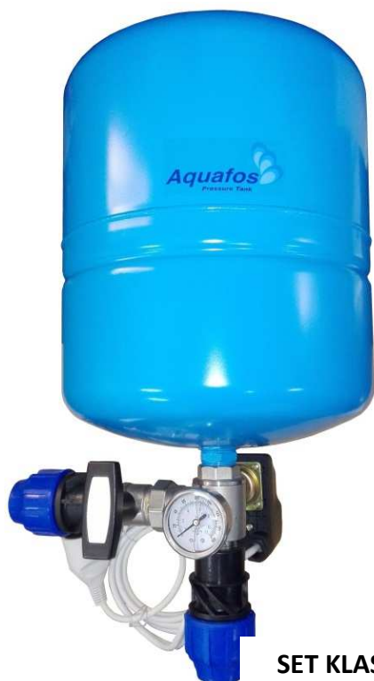
SET KLASIK 1 s 24l nádobou

Tradičný čerpací systém pozostávajúci obvykle z ponorného čerpadla, tlakového spínača a tlakovej nádoby. V prípade dostatočne výdatného vrtu, správnej voľby dostatočne veľkej tlakovej nádoby a kontroly a nastavenia tlakového spínača pri prvom spustení (aby nedochádzalo k častým štartom) môže fungovať tento systém dlhodobo a spoľahlivo.