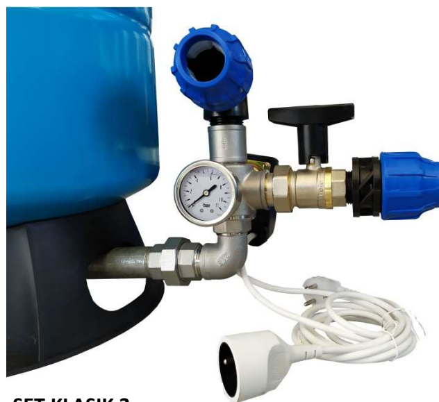
SET KLASIK 3 k samostatne stojacej nádobe