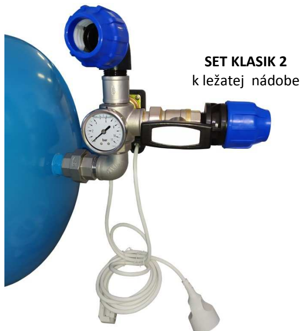
SET KLASIK 2 k ležatej nádobe

○ PILOT, FULLAPP ovládací panel ( komplexná motorová ochrana). Vhodné pre náročné, alebo priemyselné aplikácie čerpania vody. Vhodné aj pre manuálnu prevádzku čerpadla, alebo ako zdroj tlakovej vody pre zásobovanie priemyselných objektov.